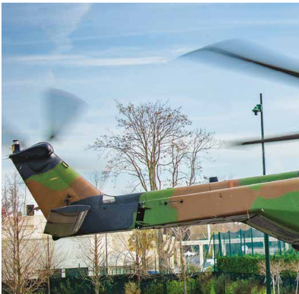
L'hélicoptère Caiman s'est posé sur l'aire d'atterrissage improvisée aux abords du Palais des Sports.