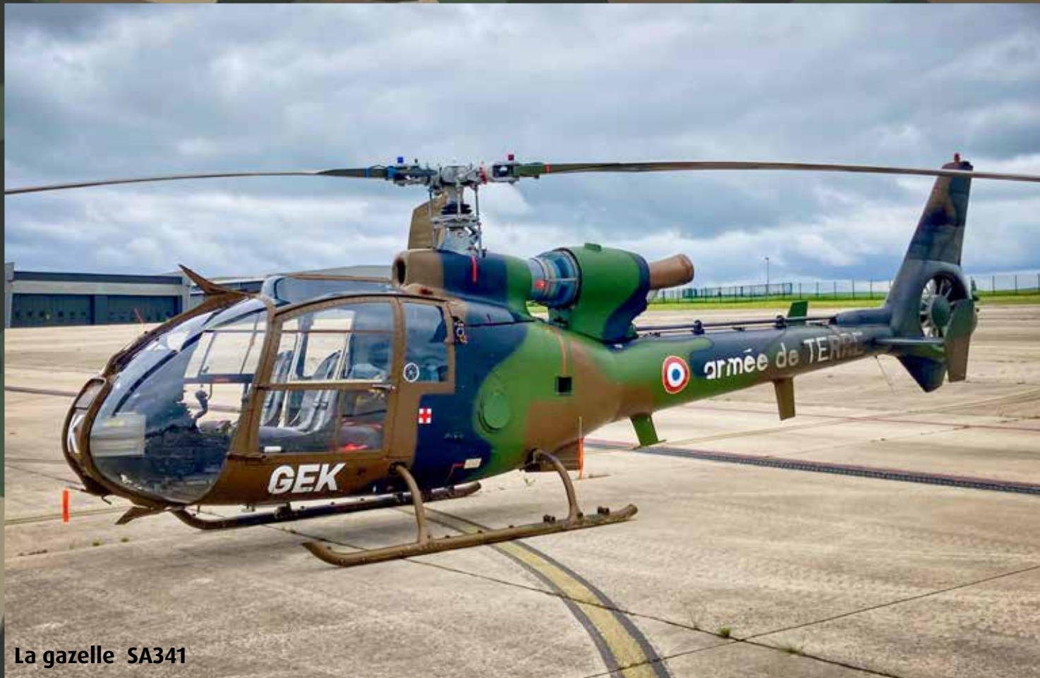
La gazelle SA341