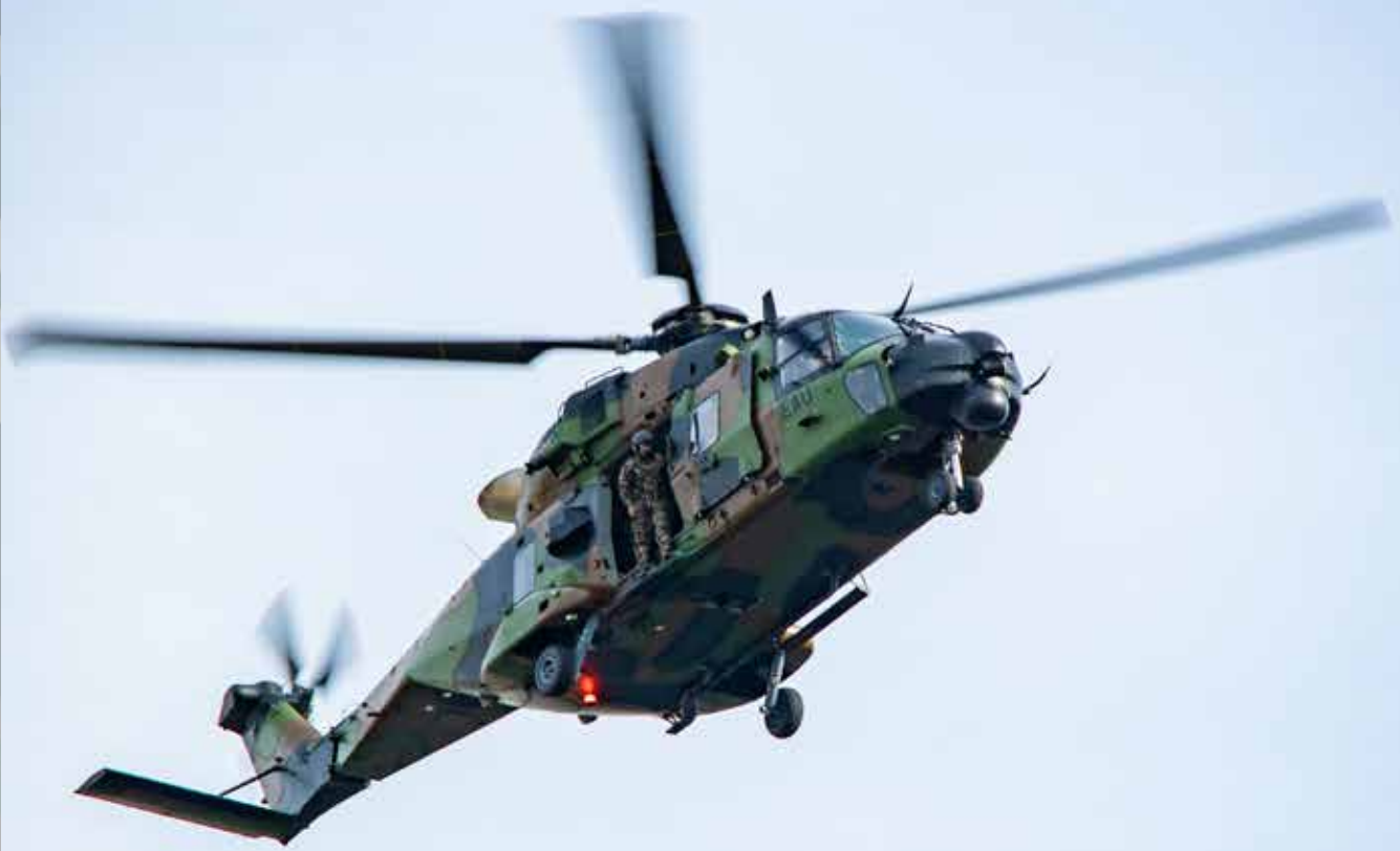
Le Caïman NH90