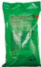
Les 3 repas de la journée sont contenus dans ces rations préparées par des chefs cuisiniers