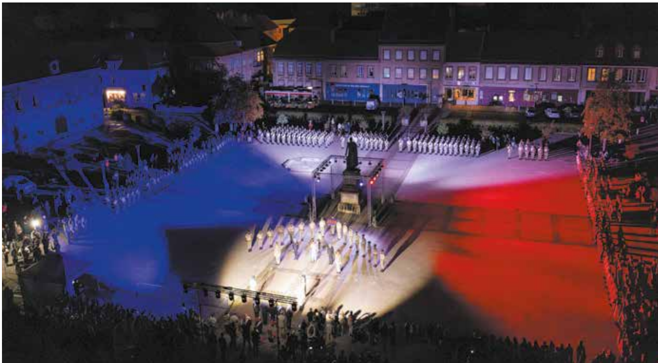
Place d'armes de Phalsbourg