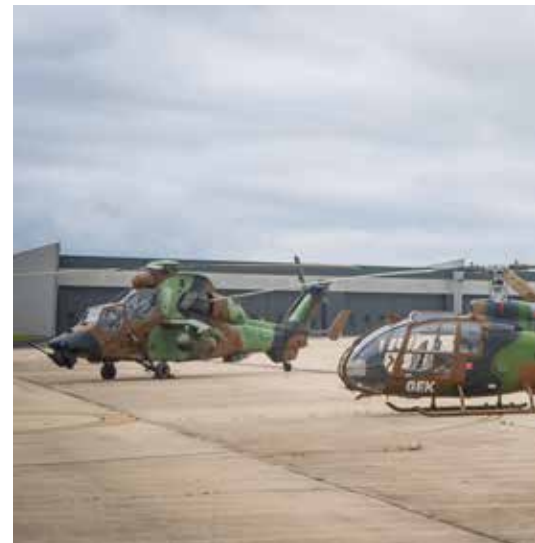
L'hélicoptère « le tigre » et « la gazelle »

En entérinant ce marrainage, le régiment renoue avec une tradition datant de l'Ancien Régime, dans la droite lignée de nos aïeux qui partaient à l'aventure sur des vaisseaux de ligne, arborant fièrement à leur poupe le nom de la Ville qui avait soutenu leur construction. Depuis un an, le régiment et la Ville se sont engagés à saisir avec enthousiasme toutes les opportunités pour affermir cette relation : partenariat à venir avec le pe-