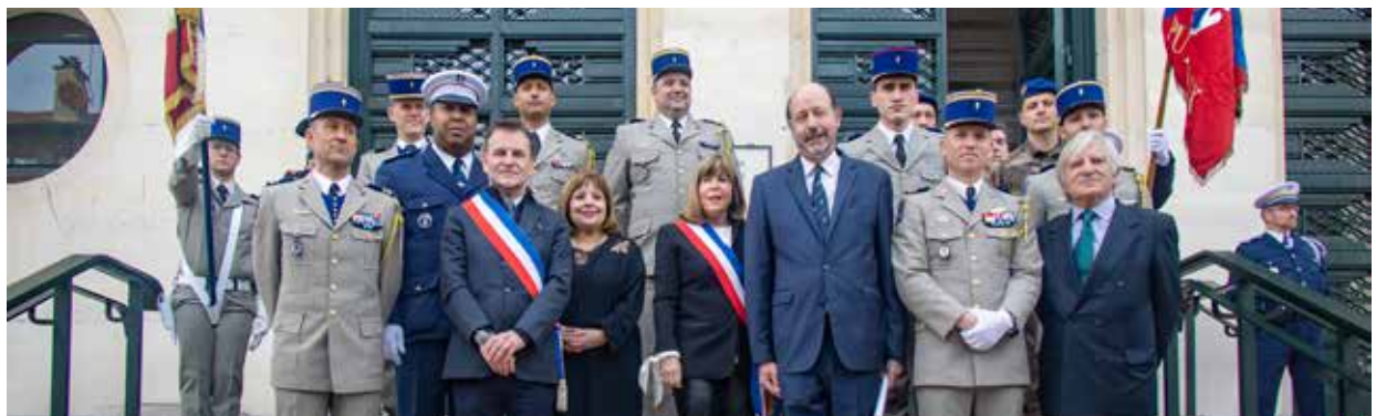
Cette journée marque le symbole du lien indéfectible entre les Putéoliens et ses forces armées.