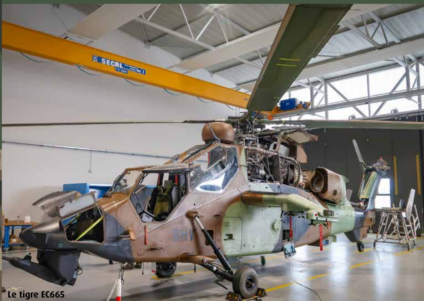
Le tigre EC665