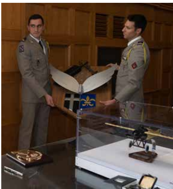
Lors de la signature de la charte de marrainage, des présents ont été remis à la Ville et au régiment.