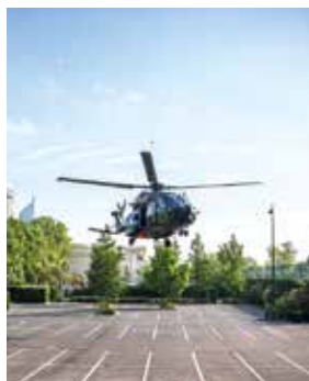
L'hélicoptère Caiman NH90 a atterri sur le parking de l'île de Puteaux.

Le Caïman, quant à lui, est un appareil de transport tactique capable d'intervenir de jour comme de nuit, en milieu hostile ou