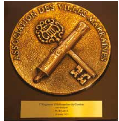
Médaille de l'association des villes mairaines.