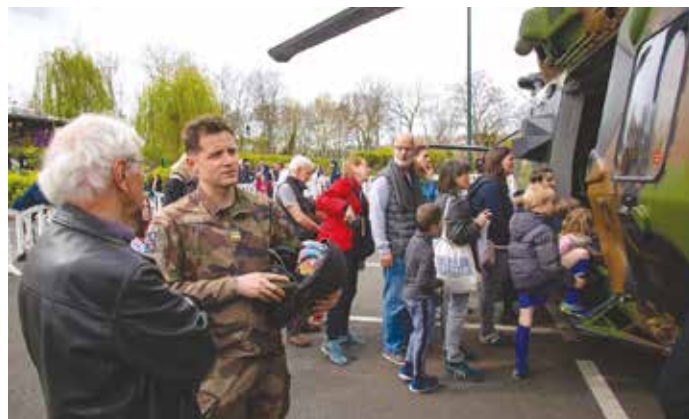
Les Putéoliens ont rencontrés les troupes du 1 er RHC de Phalsbourg