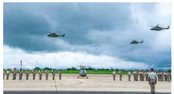
Un défilé militaire aérien pour honorer la délégation de Puteaux et les soldats médaillés