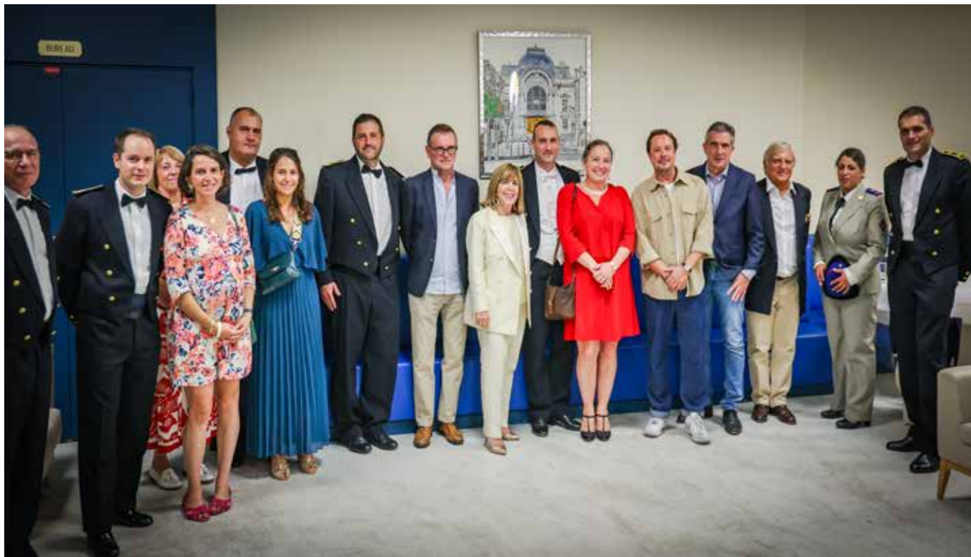
Les militaires de Phalsbourg étaient présents lors de la représentation