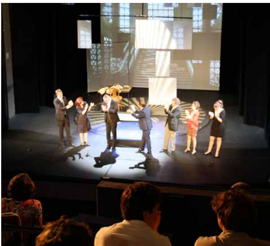
Portée par des comédiens survoltés, la pièce épingle les travers du pouvoir et ses petits arrangements

Cet événement culturel marquait une nouvelle facette des liens unissant notre ville avec le 1 er RHC, renforçant ainsi leur relation tout en affirmant leur volonté de bâtir un avenir commun.