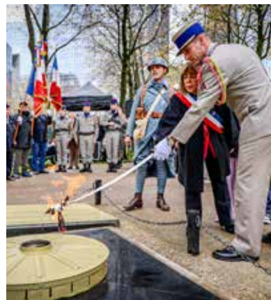
Cérémonies du 8 mai et 11 novembre au Cimetière Nouveau, en présence du 1 er Régiment d'Hélicoptères de Combat (RHC) de Phalsbourg, en 2023, 2024 et 2025.