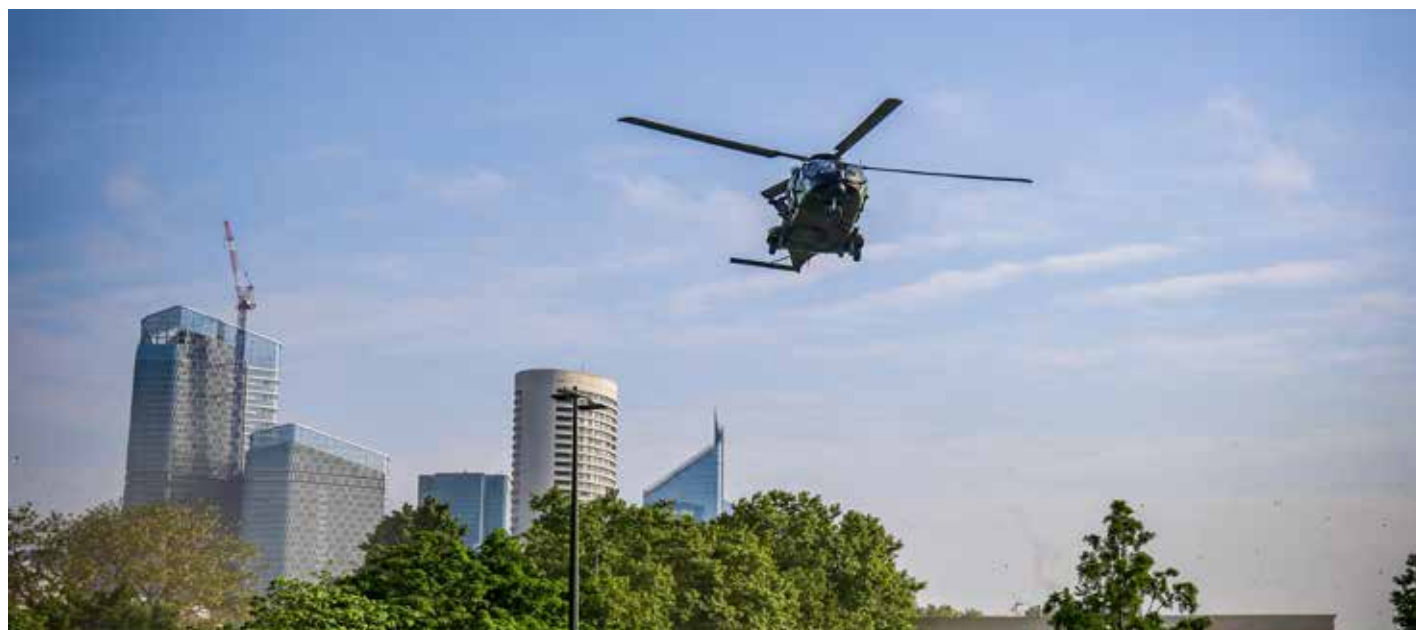
Atterrissage de l'hélicoptère Caiman sur l'île de Puteaux.