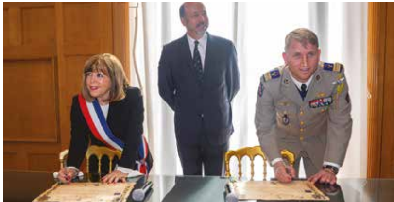
Signature de la charte de marrainage.