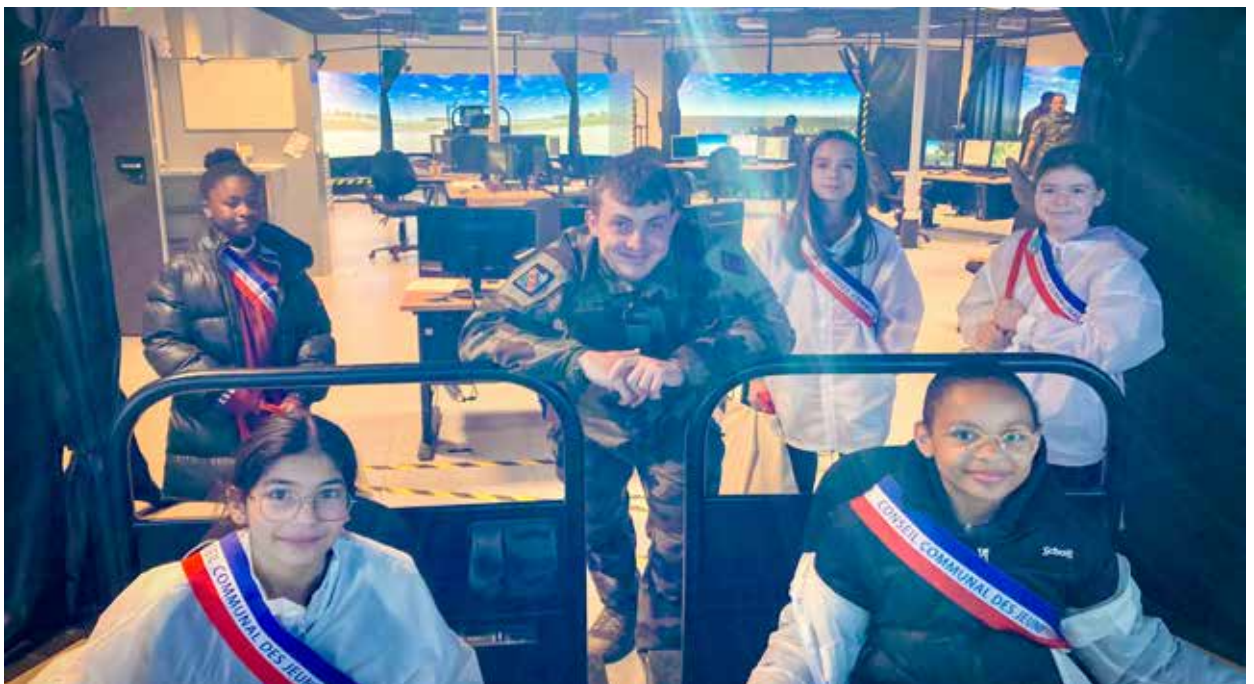
Les jeunes élus ont pu découvrir les rations de combat et essayer le simulateur de vol.

Dans le cadre du marrainage qui unit la Ville de Puteaux au 1 er Régiment d'Hélicoptères de Combat de Phalsbourg, les liens entre la jeunesse putéolienne et les forces armées ont continué de se renforcer.