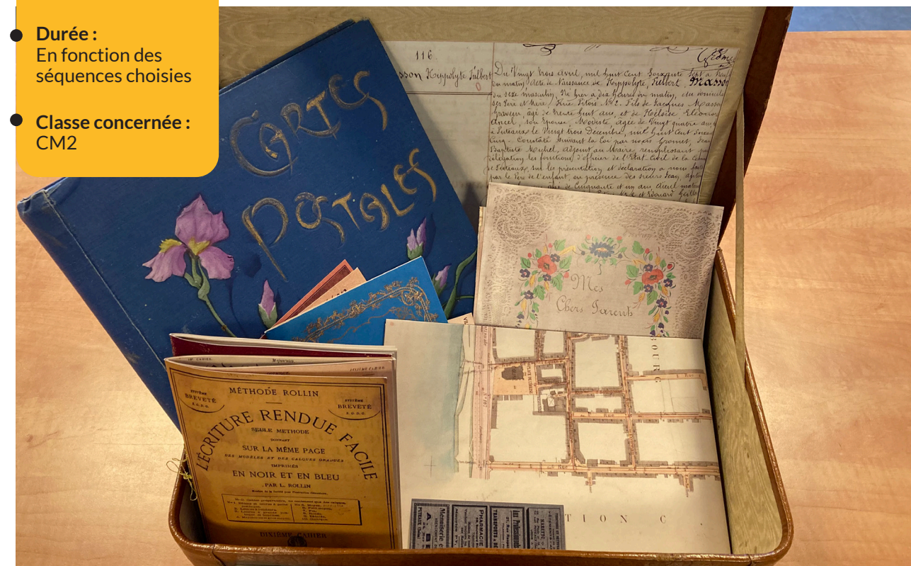
Vue de la mallette pédagogique – 2021 © Archives municipales de Puteaux

Afin de découvrir comment vivaient autrefois les habitants et habitantes de Puteaux, la mallette pédagogique « Sur les traces d'Hippolyte » a été créée. Cette mallette permet de retracer le parcours d'Hippolyte Masson, né en 1867 et mort en 1942, qui a passé toute sa vie à Puteaux.