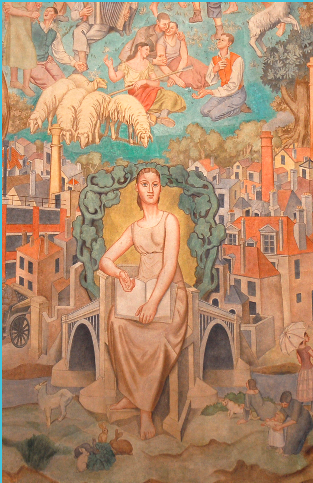
Alégorie de Puteaux, photographie de la fresque des escaliers d'honneur, 2021, AMP