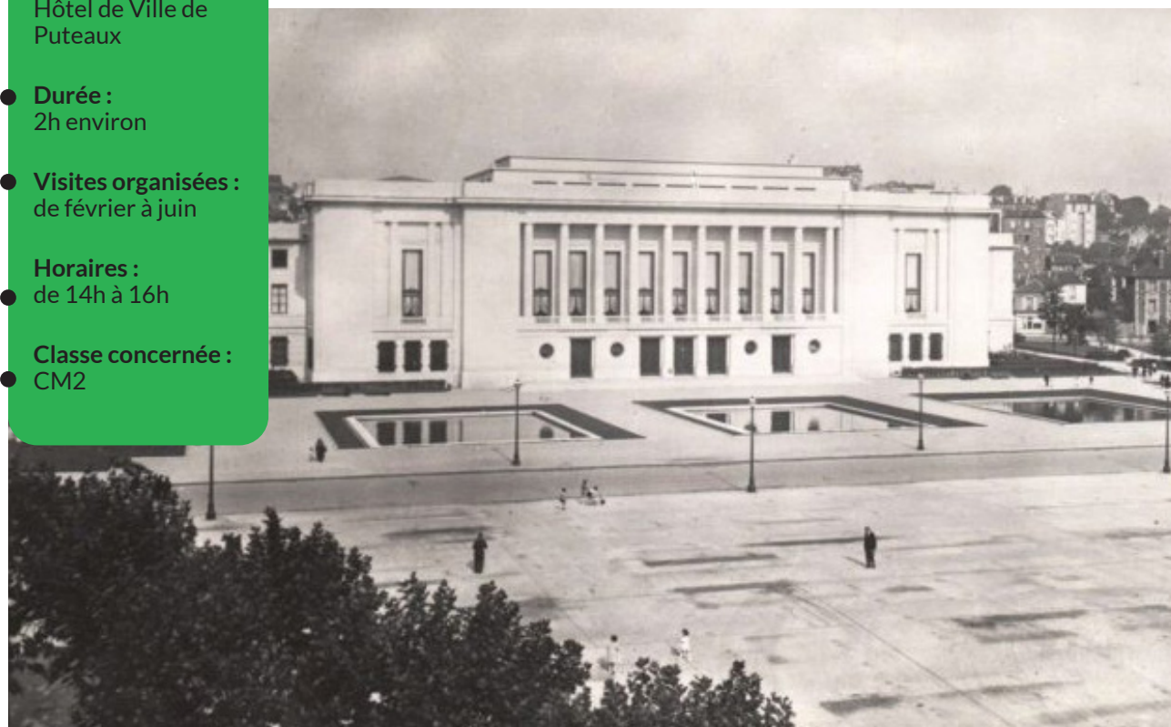
Hôtel de Ville côté esplanade – années 1930-1940 – 2Fi 325

L'Hôtel de ville de Puteaux, construit de 1930 à 1934, est inauguré le 24 juin 1934. Témoin emblématique du courant architectural des années 1930, l'édifice, édifié sur un vaste terrain de plus de 25000 m 2 , est un savant mélange entre le style néoclassique côté esplanade et moderne pour le reste du bâtiment.