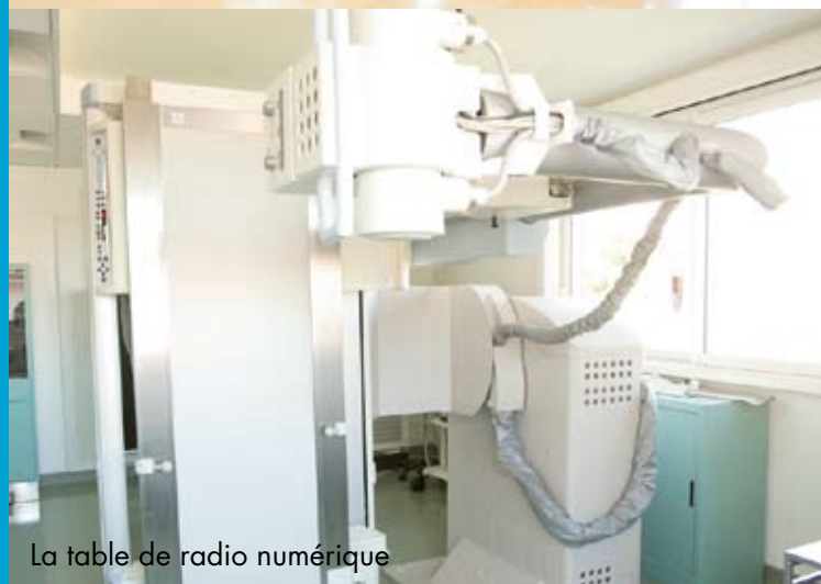
La table de radio numérique