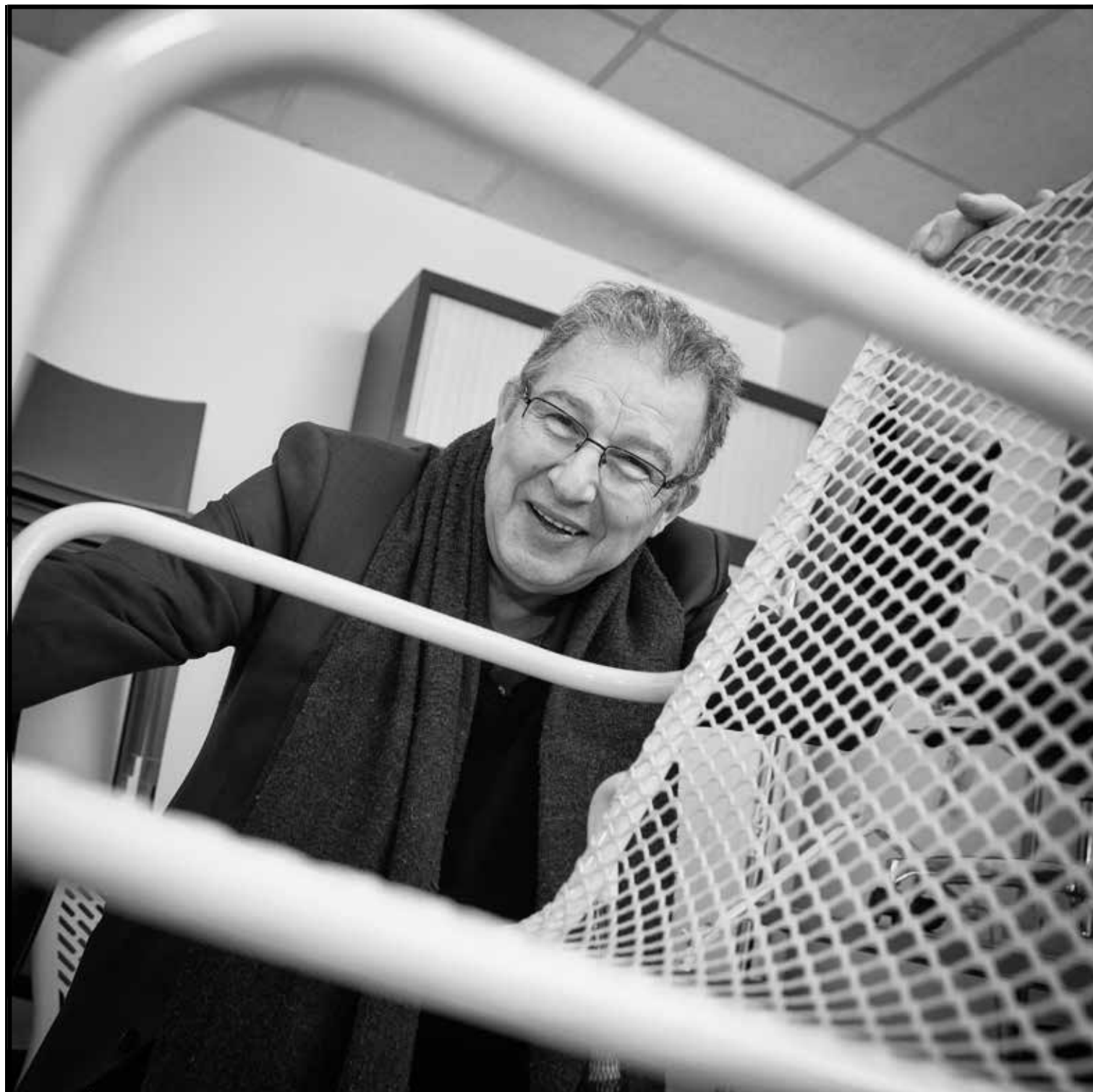
MOBILIER DE BUREAU Pierre Sebbah - Cité artisanale