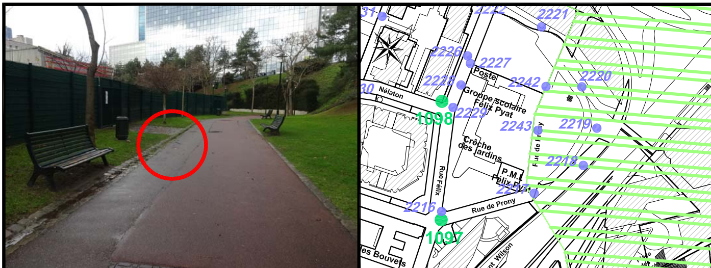
Schéma de repérage: