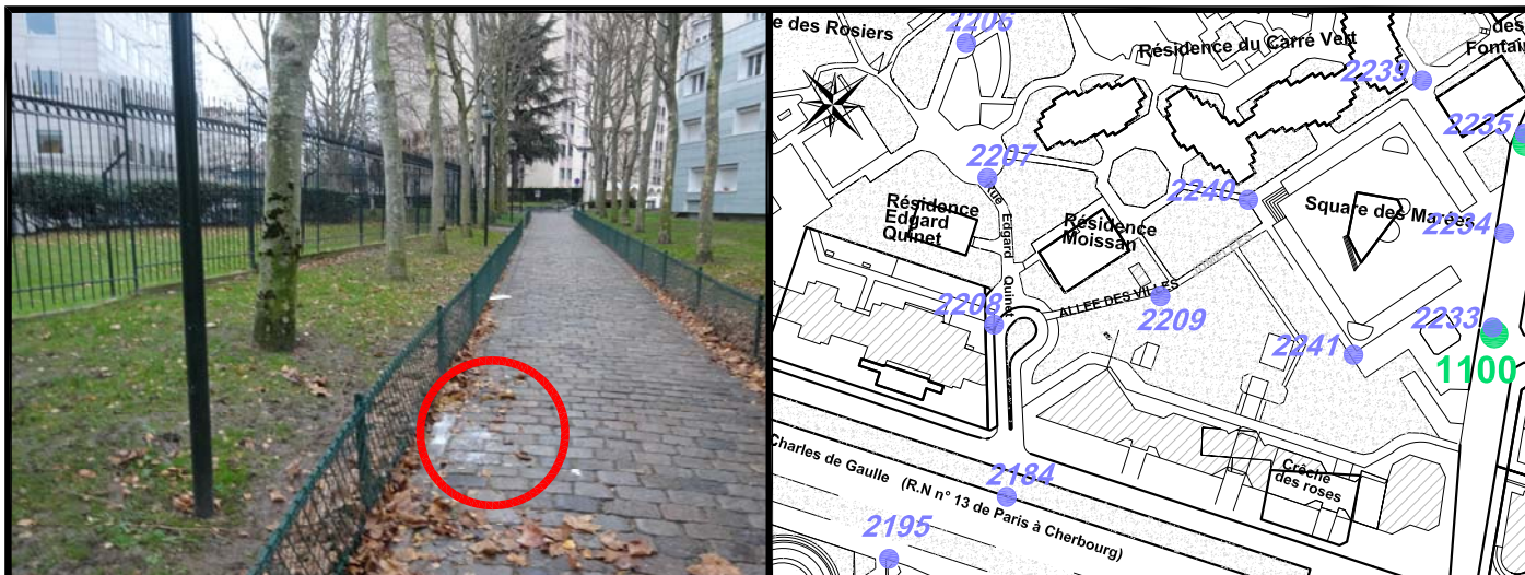
Schéma de repérage:

Liaison rue Edgar Quinet - rue Charles Lorilleux