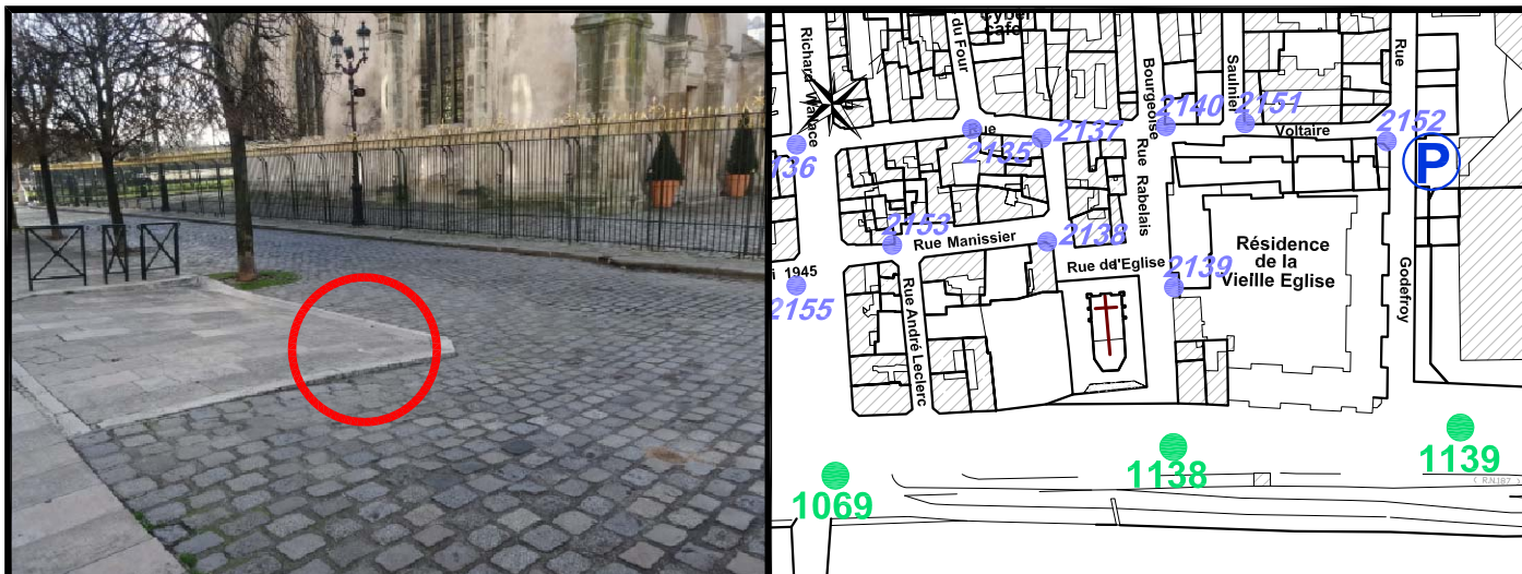
Schéma de repérage:

Rue de l'Église Intersection avec Rue Rabelais