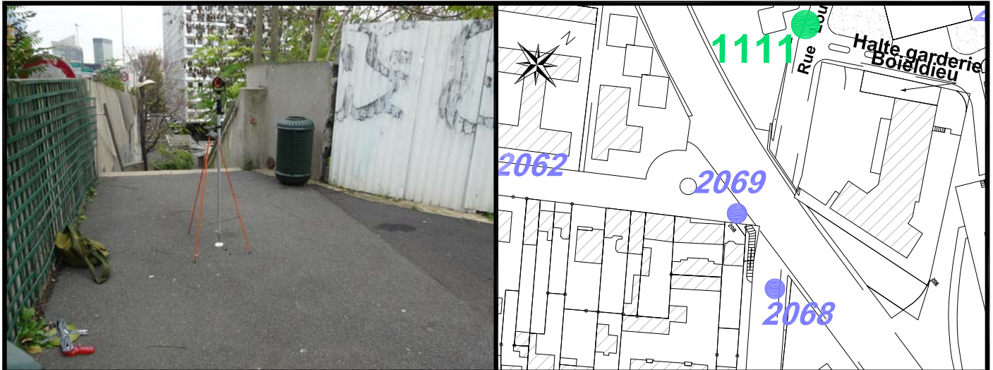
Schéma de repérage: