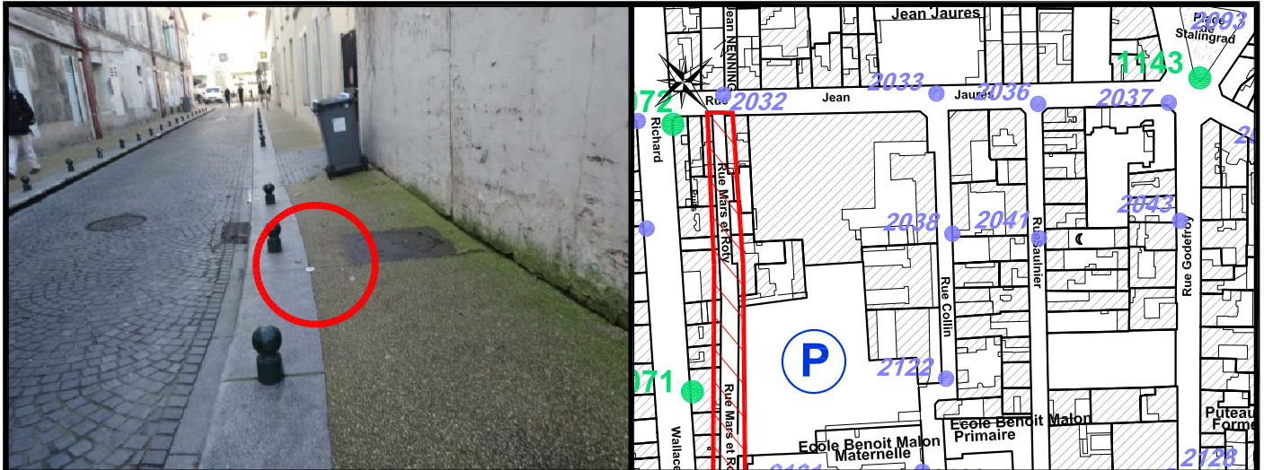
Schéma de repérage: