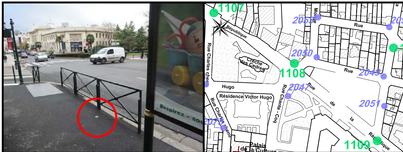
Schéma de repérage:

Rue de la République Intersection avec la rue Monge