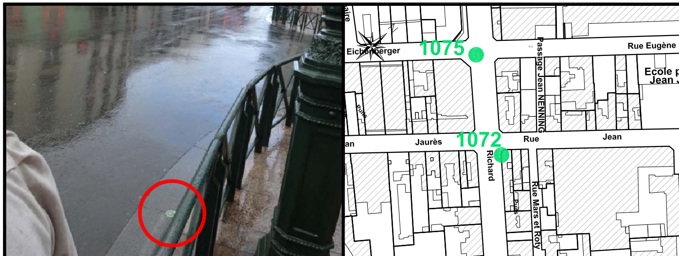
Schéma de repérage: