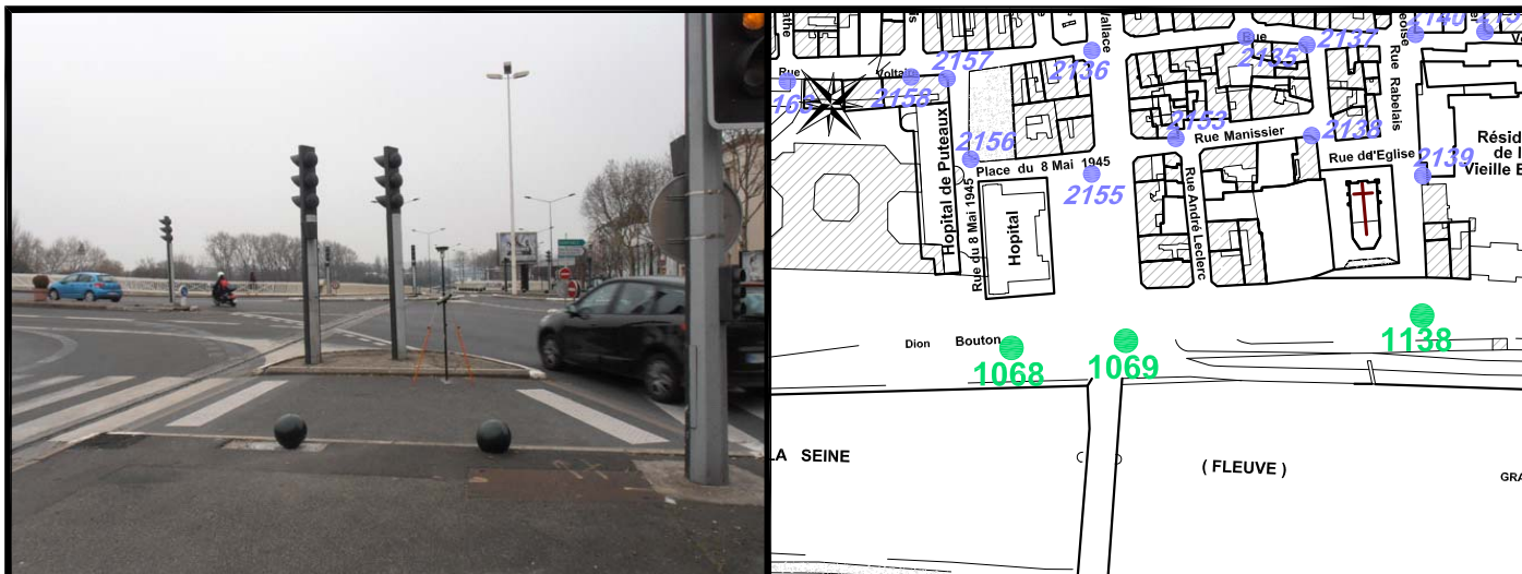
Schéma de repérage: