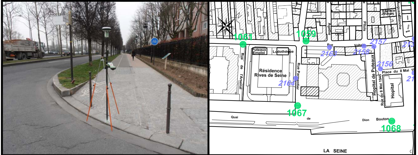
Schéma de repérage: