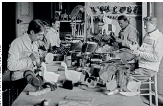
Atelier de peinture de jouets par les mutilés de guerre