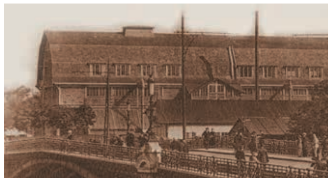
Vue de l'usine de fabrication de jouets sur l'Île de Puteaux – 2Fig40