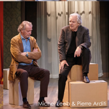
Michel Leeb & Pierre Arditi