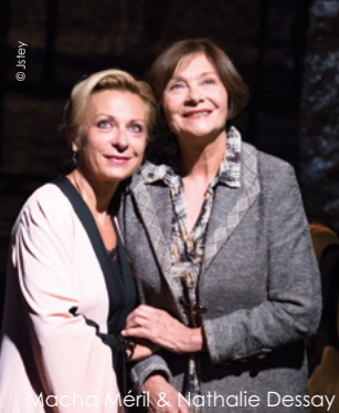
Macha Méril & Nathalie Dessay