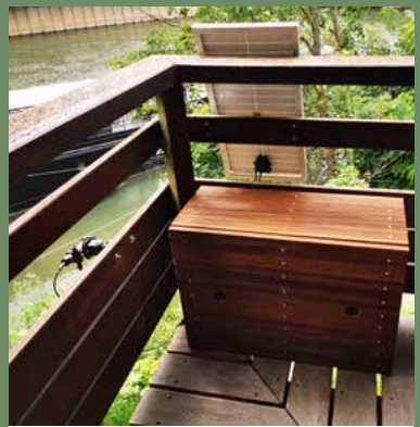
Le capteur à chauve-souris

..... Le Naturoscope est équipé d'une technologique innovante permettant de capter la présence des chauves-souris . Une étude importante sur leur présence et sur leur comportement est en cours sur l'Île de Puteaux mais aussi dans le nouveau quartier des Bergères. Les signaux que renvoient les chiroptères permettent de donner des indications sur l'état de la biodiversité dans le milieu observé.