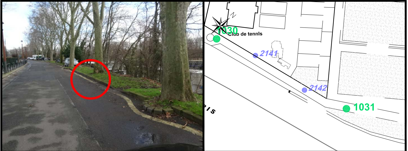
Schéma de repérage: